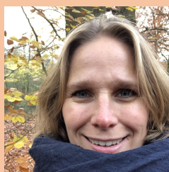
Claartje GMR-lid en leerkracht (3 en 5)